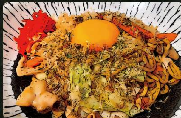
黄身のそば☆ 690円 (税込759円)