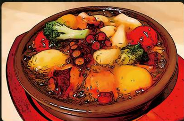
タコのアヒージョ(バケット付) 690円 (税込759円)