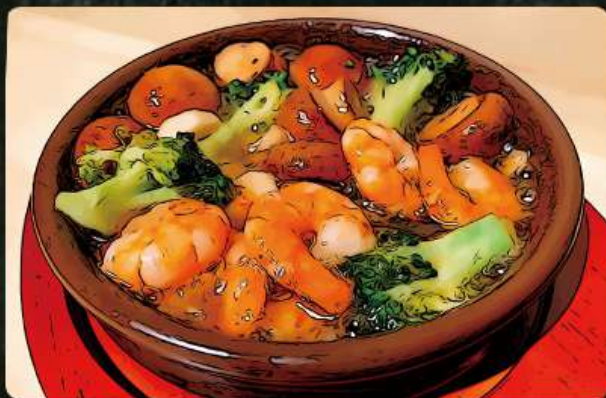
海老のアヒージョ(バケット付) 690円 (税込759円)