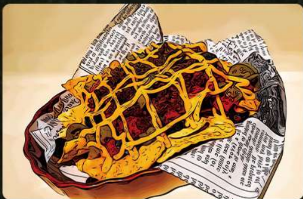
ナチョス 690円(税込759円)