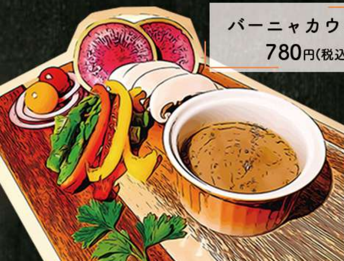
バーニャカウダー 780円(税込858円)