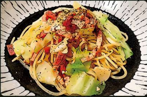
キャベツのペペロンチーノ 780円 (税込858円)