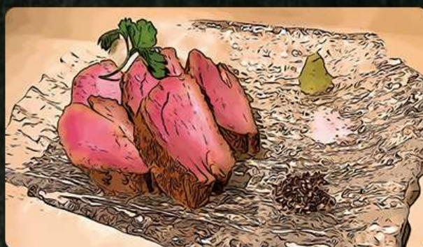
鴨ロース 690円(税込759円)