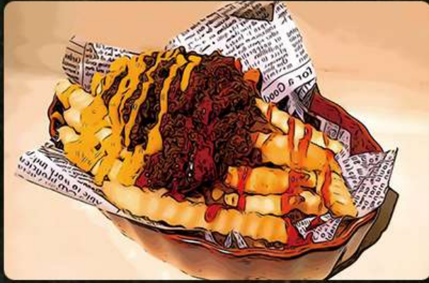
ジャンキーポテト 690円(税込759円)