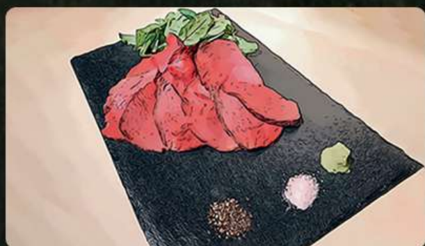
ローストビーフ 690円(税込759円)