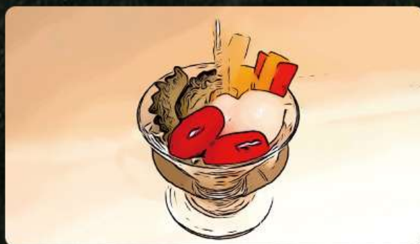
自家製ピクルス 490円(税込539円)