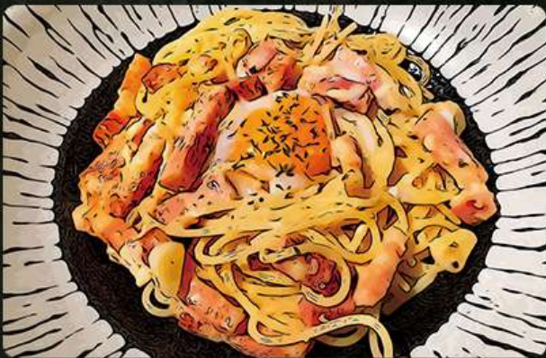
カルボナーラ 780円 (税込858円)