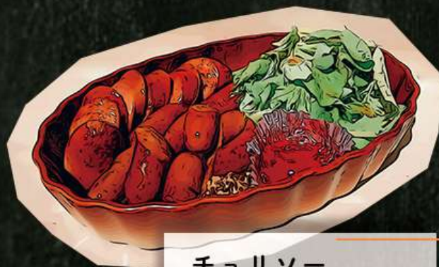
チョリソー 690円(税込759円)