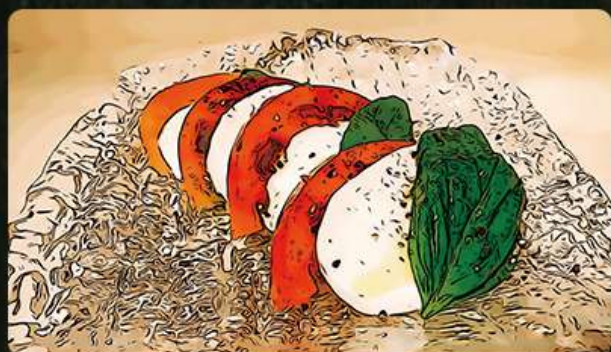
カプレーゼ 590円(税込649円)