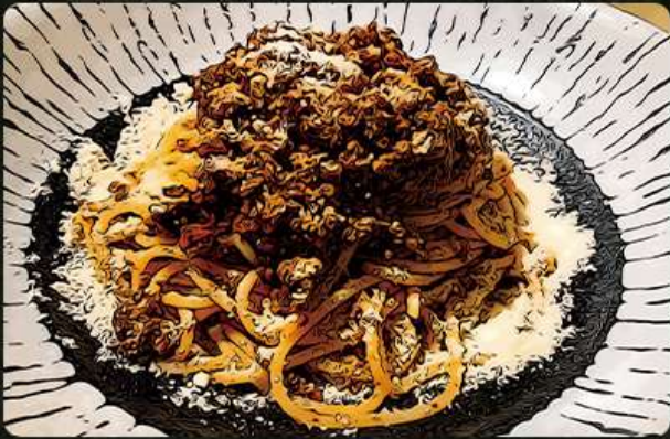
ボロネーゼ 780円 (税込858円)